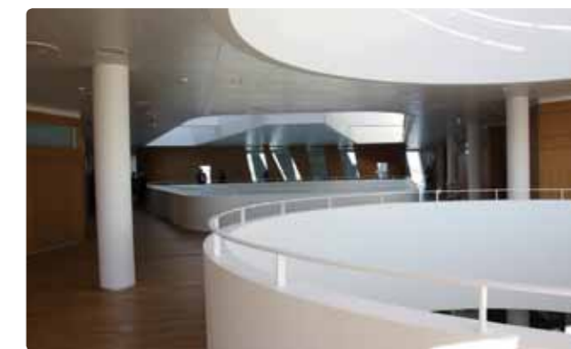
Öresund TOP10 deltagare 2010, som hölls tillsammans med CONNECT Danmark, hos danska partnern Hortens advokatbyrå, i deras nya lokaler i Hellerup